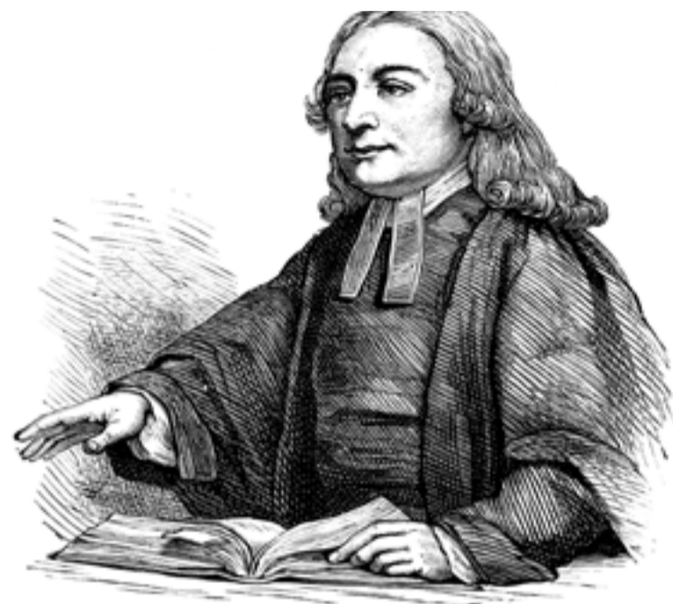
Imagen de Juan Wesley

A vivamiento”, “despertar espiritual”, “visitación divina”, son acciones que describen la soberana del Espíritu Santo en medio de la Iglesia y la sociedad en la que está inmersa. A finales de la década de 1730 en Inglaterra, se vivió un avivamiento que sacudió a la Iglesia y la sociedad británica. Cabe señalar a tres personas que se distinguieron por su contribución en esa gesta histórica de avivamiento, a saber: John Wesley, Charles Wesley y George Whitefield; ministros ordenados de la Iglesia Anglicana.